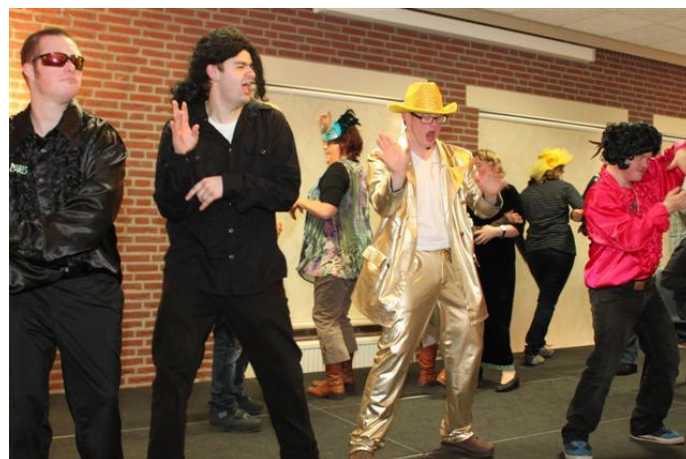
Cliënten organiseren hun eigen open podium -Fatima Zorg-